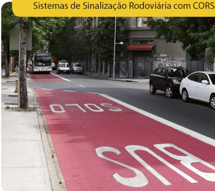
Sinalização de faixa BUS em vermelho: base de CORSAFE®

Sistemas de Sinalização Rodoviária com CORSAFE®