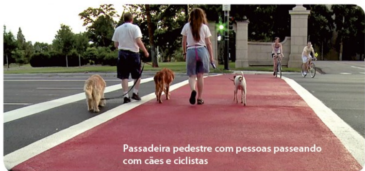
Passadeira pedestre com pessoas passeando com cães e ciclistas

www.candela.com.pt • geral@candela.com.pt